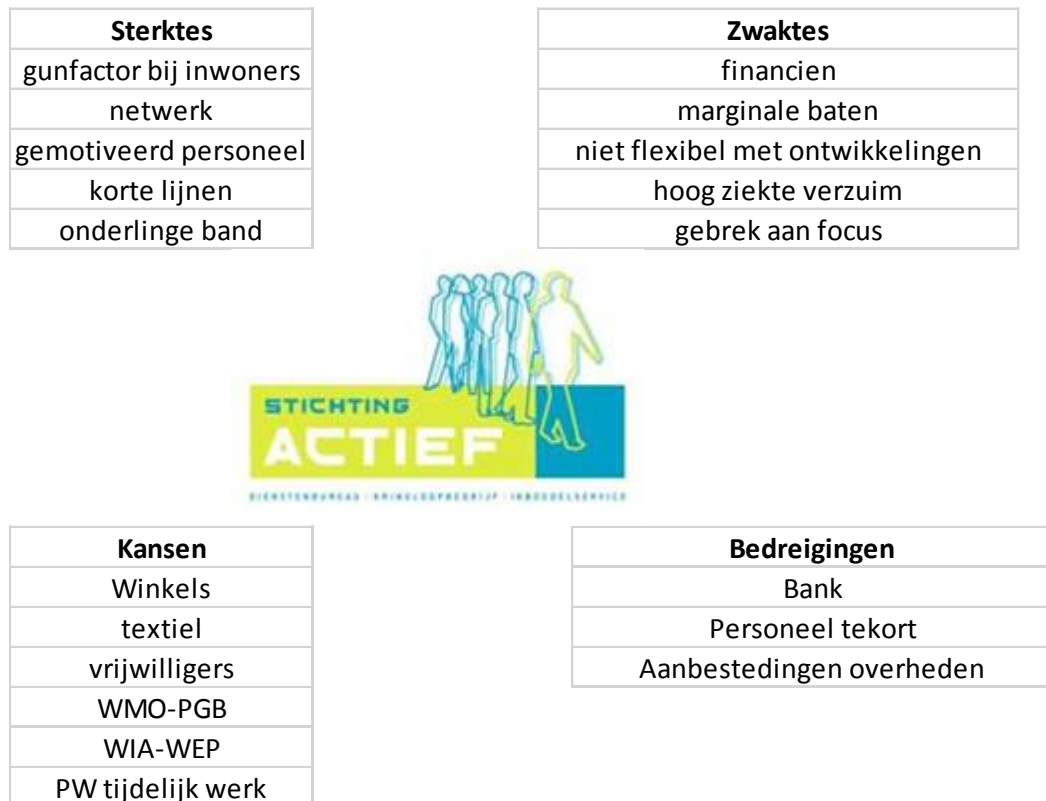
Figuur C: SWOT-analyse Stichting Actief

Wat is onze kracht en wat zijn onze zwakke plekken? Waar liggen de kansen voor onze organisatie en waar de valkuilen? De onderstaande figuur geeft hier inzicht in.